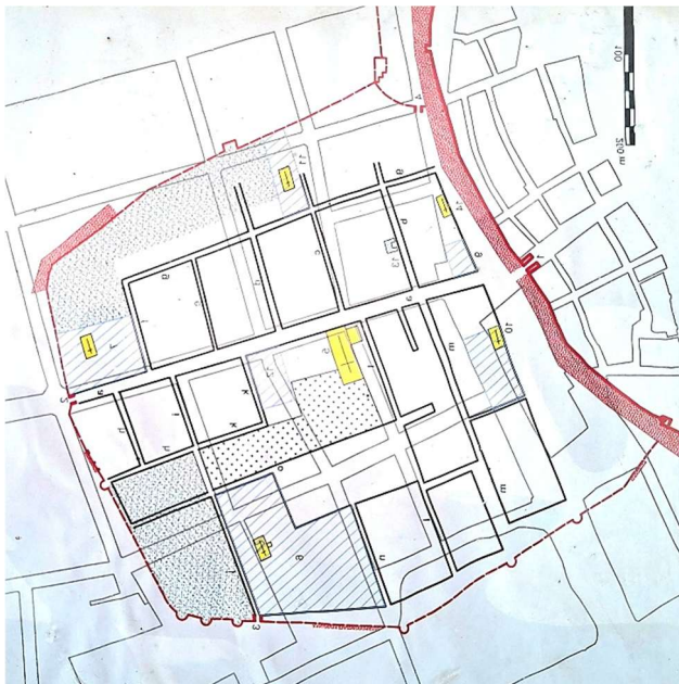
Stadtplan der mittelalterlichen Neuburg (von Dr. Bertram Jenisch)